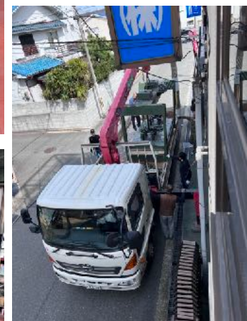
運ばれていくプレス機

長年、フラッシュドアを挟んできたプレス機がとうとう動かなくなりました。本当にお疲れ様でした。みんなでプレス機を扱うように工場の端から端まで一緒に動かし、トラックに乗せ、見送りました。もう作っているメーカーが廃業しているので交換部品がないとは聞いていましたが、別れは突然やってきました。長い間、本当に有難うございました。そして、ピカピカの二代目のお披露目になります。これからバリバリ挟み倒しますよ！宜しくお願いします。