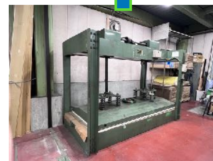
長年働いてくれたプレス機

長年、フラッシュドアを挟んできたプレス機がとうとう動かなくなりました。本当にお疲れ様でした。みんなでプレス機を扱うように工場の端から端まで一緒に動かし、トラックに乗せ、見送りました。もう作っているメーカーが廃業しているので交換部品がないとは聞いていましたが、別れは突然やってきました。長い間、本当に有難うございました。そして、ピカピカの二代目のお披露目になります。これからバリバリ挟み倒しますよ！宜しくお願いします。